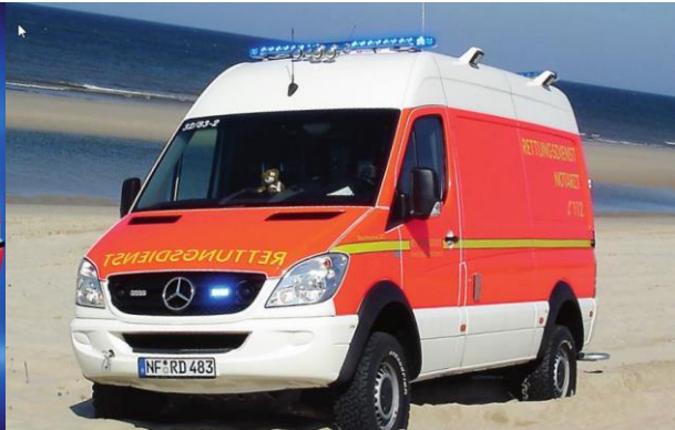
XCESS-Lichtbalken auf einem RTW • mit LED-Front-Komplettausstattung • mit verdeckter Tonfolgeanlage • mit zweitem LED-Hecksicherungs balken • mit LED-Frontblitzern