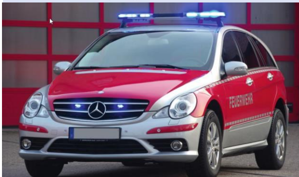
XPERT-Lichtbalken auf einem Einsatzfahrzeug (Leiter Feuerwehr) • mit LED-Front-Komplettausstattung • mit LED-Hecksicherung • mit verdeckter Tonfolgeanlage • mit LED-Frontblitzer • mit LED-Kofferraumdeckel-Blitzer