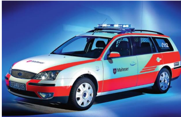
XCESS-Lichtbalken auf einem Kurierfahrzeug • mit LED-Front-Komplettausstattung • mit LED-Hecksicherung • mit verdeckter Tonfolgeanlage • mit LED-Frontblitzern