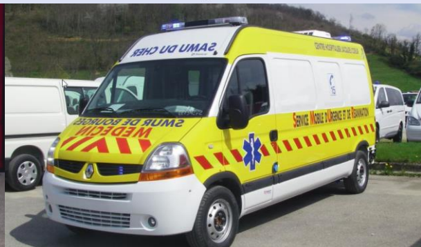
XPERT-Lichtbalken auf einem RTW • mit LED-Front-Komplettausstattung • mit LED-Hecksicherung • mit verdeckter Tonfolgeanlage • mit LED-Frontblitzern